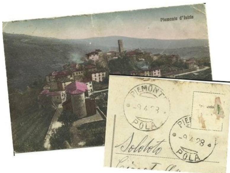
1928 - Sull'immagine classica del paese (ancora non era stata costruita la nuova scuola) l'annullo sul francobollo (che non c'è più). Un saluto ad un parente partito per il servizio militare di leva.