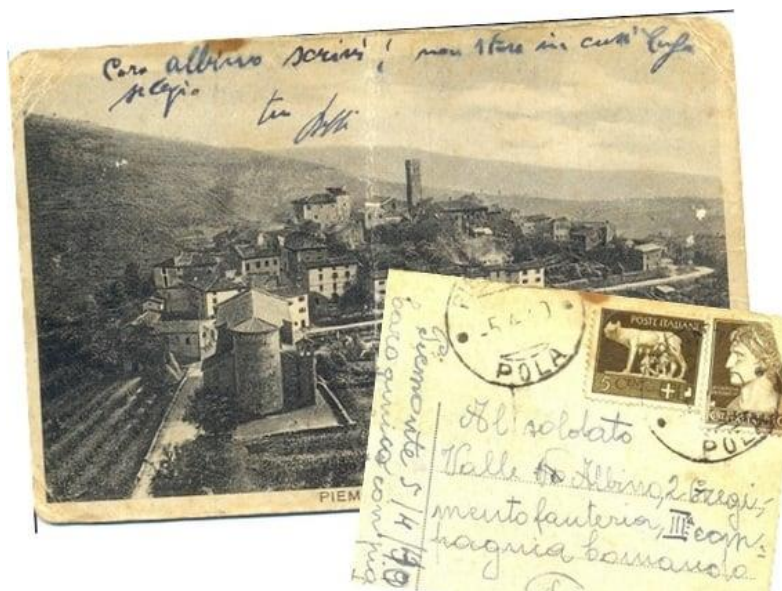
1940 - La Lupa e l'imperatore Augusto sui francobolli della cartolina inviata all'amico destinato al fronte di guerra.