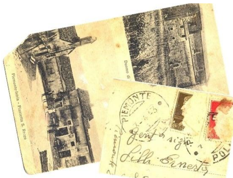
1943 - Scorci un po' datati del paese su questa cartolina con i francobolli "mangiati" inviata ad una ragazza piemontese in visita a parenti triestini. Saranno quei parenti che in molti casi daranno il loro primo aiuto, negli anni successivi, ai profughi in fuga dal paese.